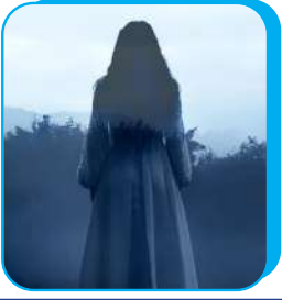
أسرار الظلام: ظواهر غامضة ومرعبة أذهلت العلماء عماد أبو الفتوح