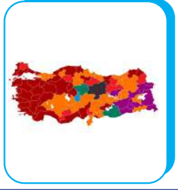
الانتخابات البلدية في تركيا: هل بدأت نهاية إردوغان؟ د.محمد نور الدين